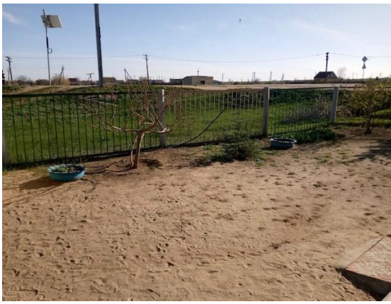
Рис.1 фото «До»